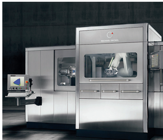
Werkzeugschleifmaschine/Tool grinding machine