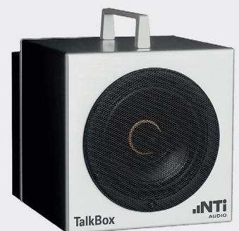
Akustische Referenzschallquelle Acoustic signal generator